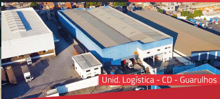
Unid. Logística - CD - Guarulhos

Desde 1993 Destacando-se como referência no mercado.