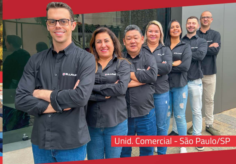
Unid. Comercial - São Paulo/SP

Desde 1993 Destacando-se como referência no mercado.