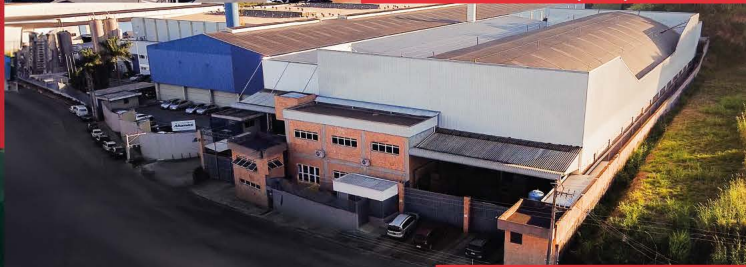
Unid. Fabril - Guarulhos