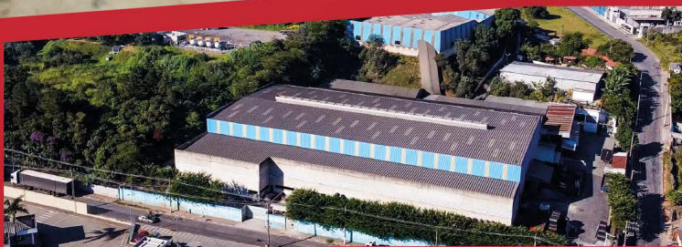
Unid. Fabril - Itaquaquecetuba